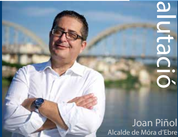
Joan Piñol Alcalde de Móra d'Ebre