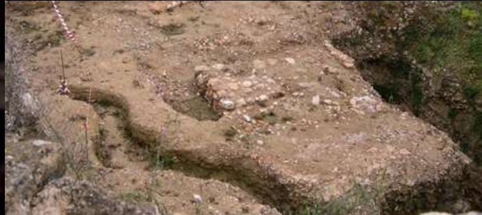
Pica aigua beneita ermita de Sant Jeroni, Joan Launes Castell dels Entença i dels ducs de Cardona, Joan Launes Detalls de les restes de la possible capella de Sta. Maria del Castell, Joan J. Duran Al centre els antics fonaments que podrien correspondre a la capella del castell (segle XII), Joan J. Duran