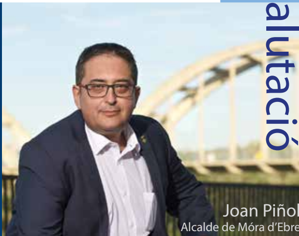
Joan Piñol Alcalde de Móra d'Ebre